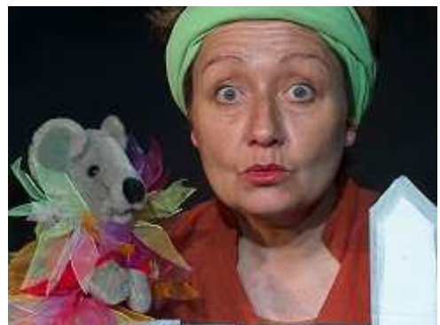
Cliquer sur l'image pour obtenir une haute résolution

Un petit castelet , un décor de jardin, des marionnettes, du théâtre d'objets, des ombres chinoises, des contes d'animaux, des chansons, des comptines, sur fond de refrains enfantins jazzy inspirés de chansons traditionnelles , « j'ai descendu dans mon jardin » est un spectacle qui s'adresse aux très jeunes enfants de maternelle . Il est conçu pour être joué en proximité, en toute intimité, et ne peut être envisagé qu'en petite jauge étant donnée la taille du décor et des personnages.