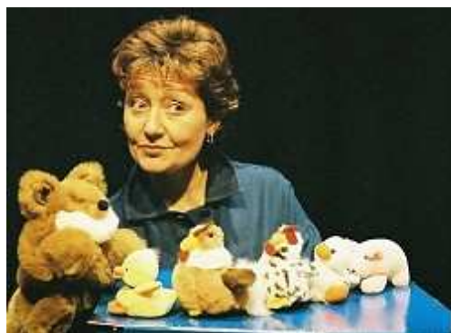
Cliquer sur l'image pour obtenir une haute résolution

Retrouvez le monde sucré de Dame Tartine, le charme des comptines, des berceuses ! Au pays