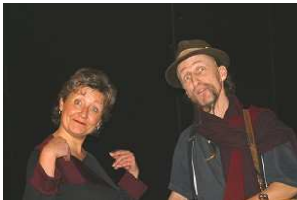
Cliquer sur l'image pour obtenir une haute résolution

L'émotion, l'humour, rythment la quête de soi, de la vérité et du bonheur, sur le chemin qu'il faut inventer pas à pas.