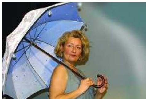
Cliquer sur l'image pour obtenir une haute résolution