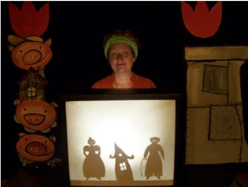
Un amour sucré salé