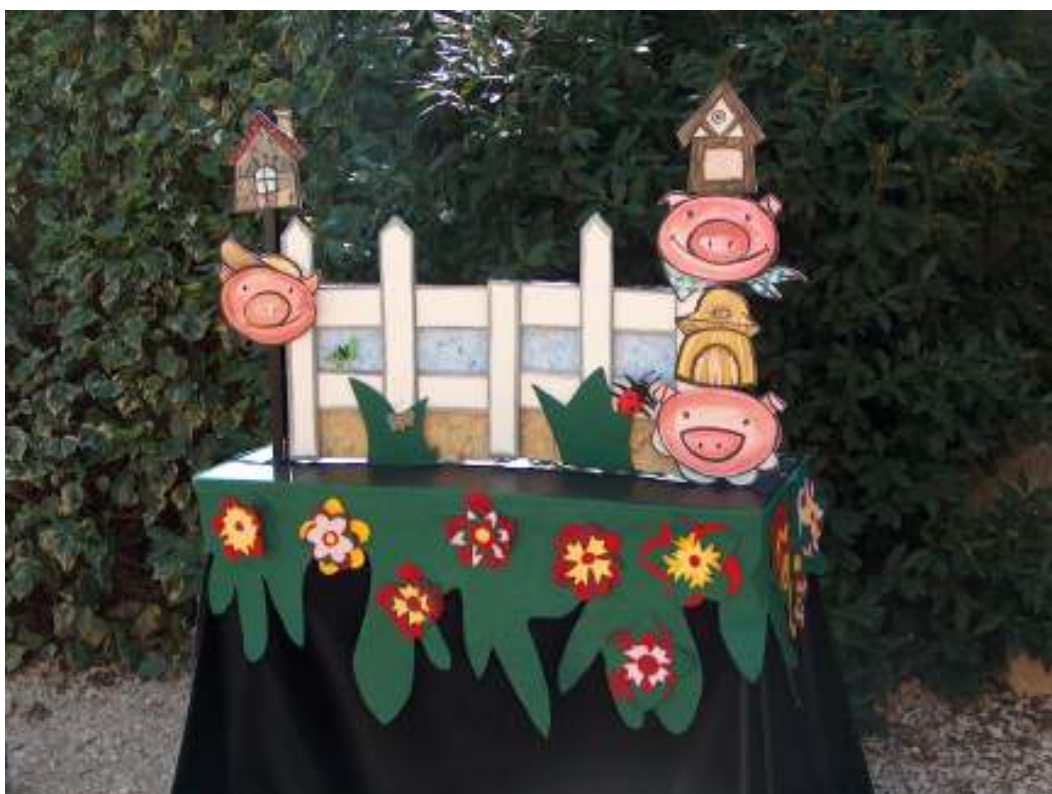
Le décor (vue générale)