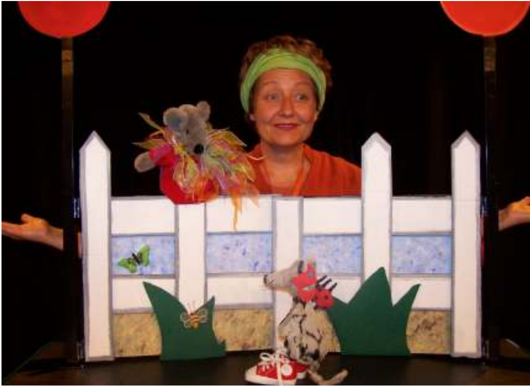
La souris qui cherche un mari