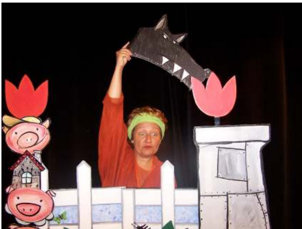
Le décor (gros plan)