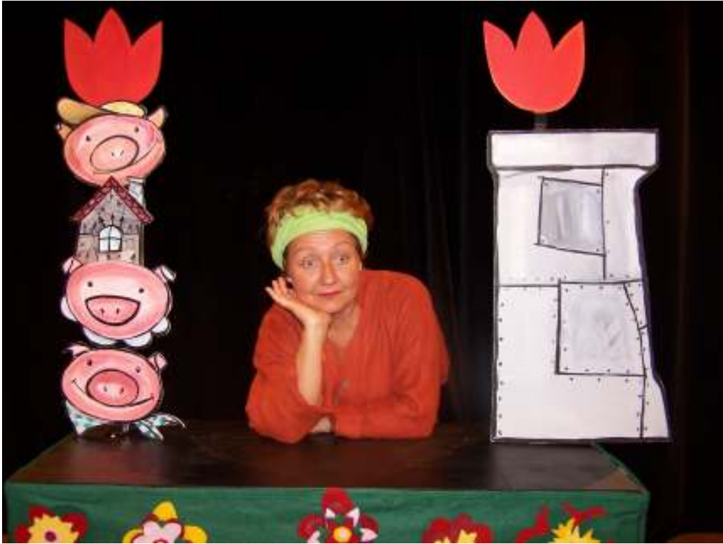
Les 3 petits cochons